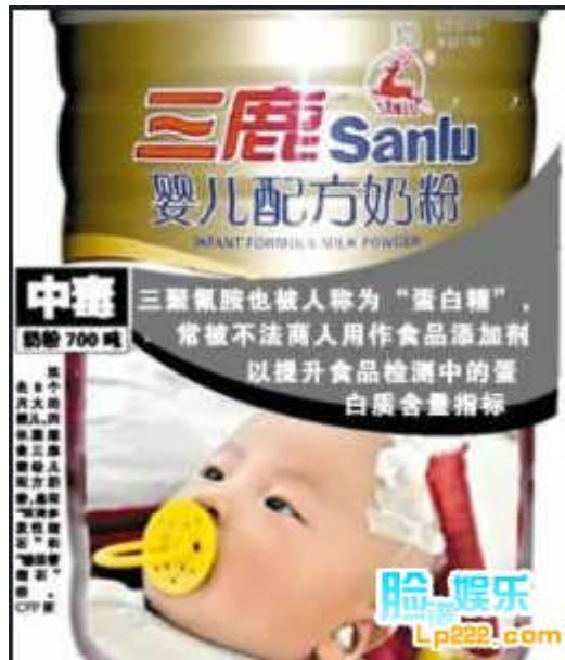
三鹿问题奶粉案一审宣判名单