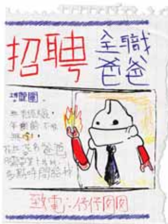
illustration by MT

也想跟太太說一聲對不起，與妳一起的時候，我總會用一半的腦袋籌算著如何解決公司的問題，忽略了要緊密地跟你一起面對家裡經濟和兒女成長的問題，還有妳情感上的需要。我明白妳很擔心我的工作，我已不斷嘗試離開這困局，但天父就是要我在這境況下不斷更新和學習。感激妳一直對我的支持。