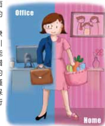
illustration by GF

Angelina在工作上有難題，會與同行小組分擔。業界之間同聲同氣，一句話就明白。要問專業意見，有行內“大哥”提點；小手作要找人，有“個體戶”來幫忙；遭遇失敗，可以無所顧慮的傾訴，有禱告的支持。她覺得：“外面不乏“成功商人”的團契，生意成功時，不錯可以分享，但潦倒的時候只能悄然引退，不像這個小組能共患難。我非常珍惜這棵“大樹”對我的護蔭。感謝神，不僅在生意上看顧我、保守我，更賜給我同行者，跟我一起守望。」